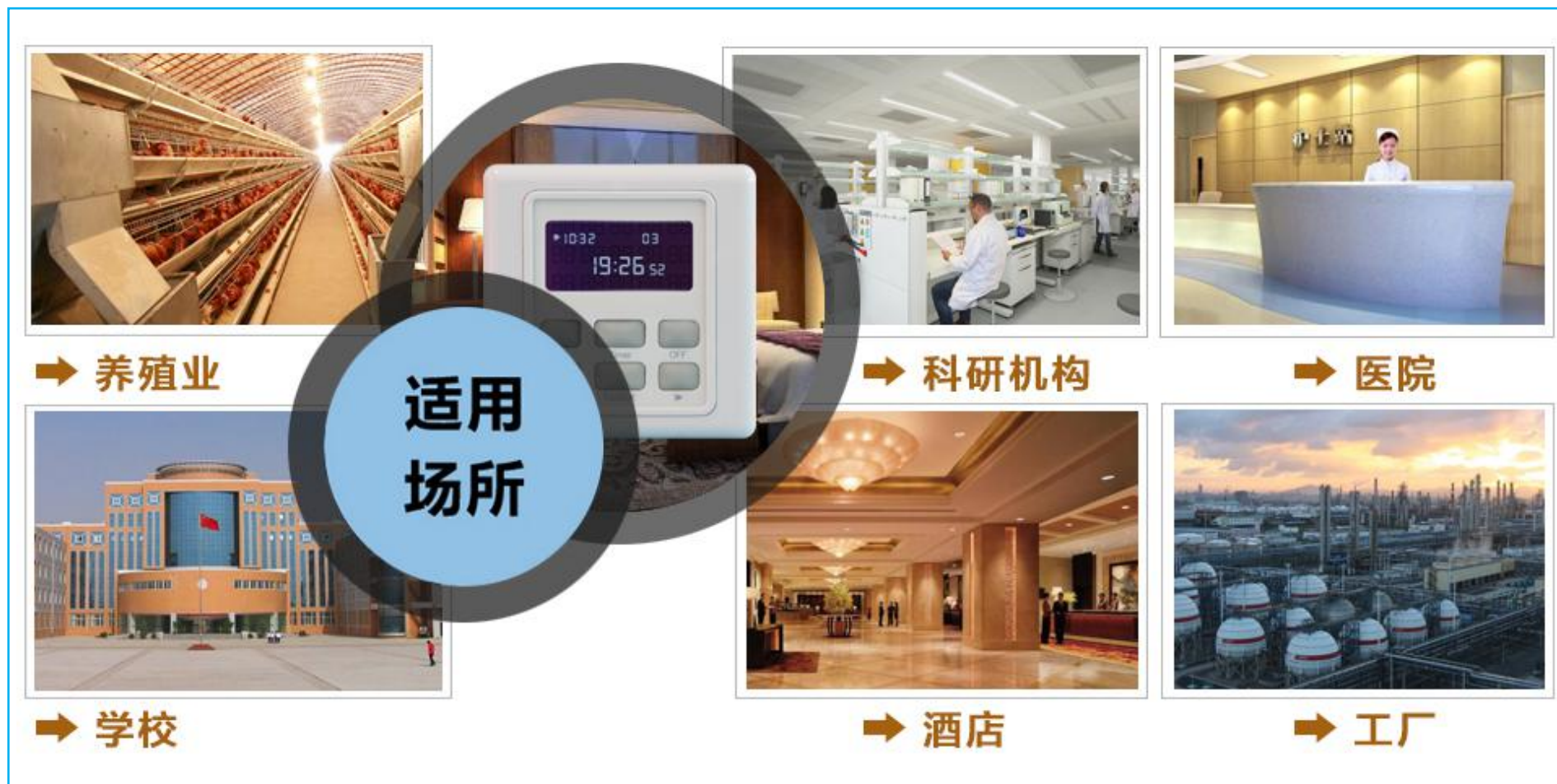
图一 产品适用场景示意图