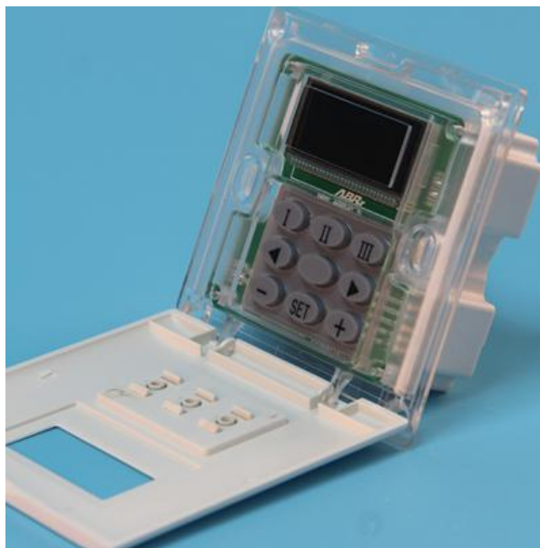
图三 产品内部结构图