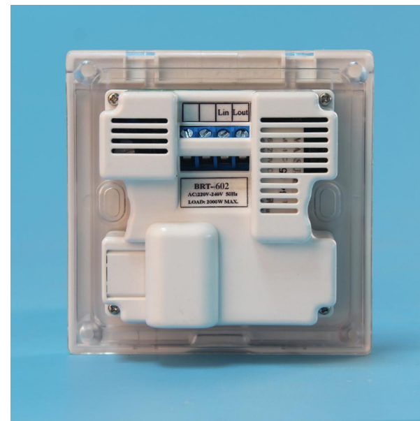
图四 产品背面结构图