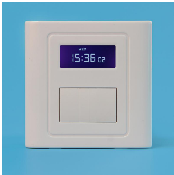
图二 产品正面结构图