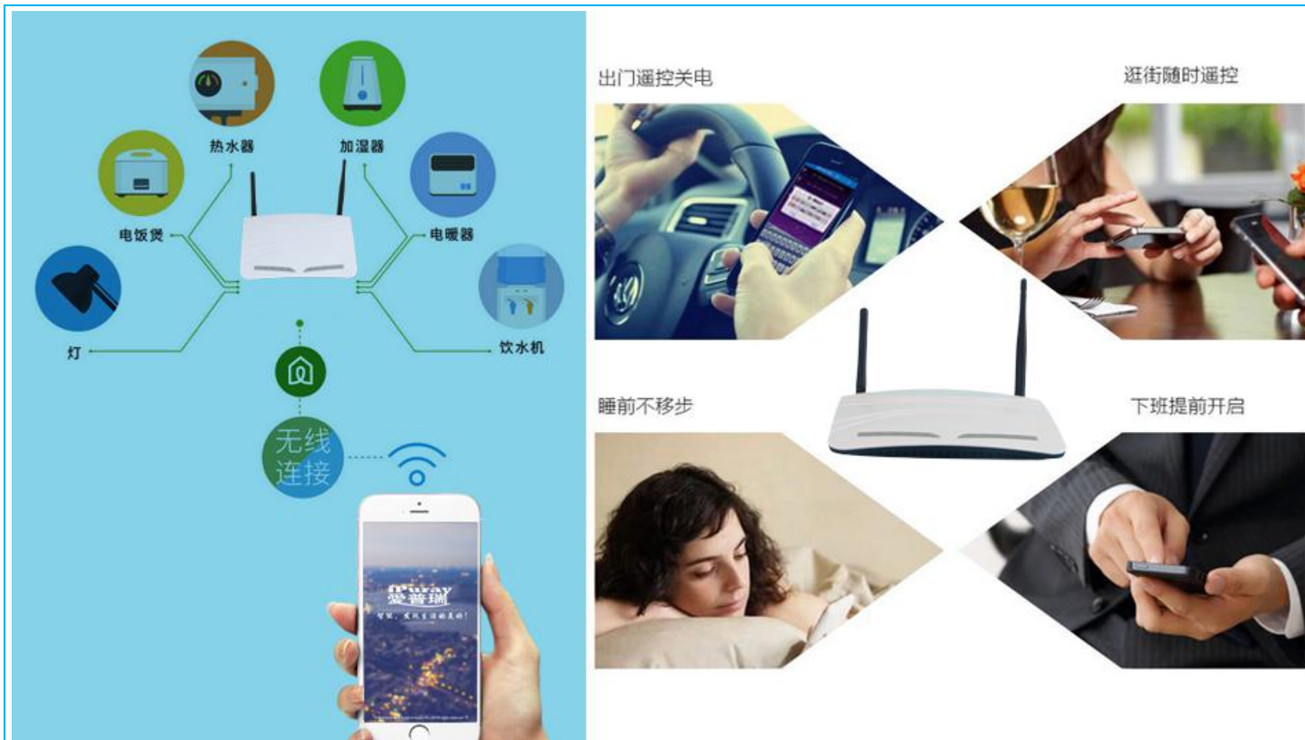
图一 产品适用场景示意图