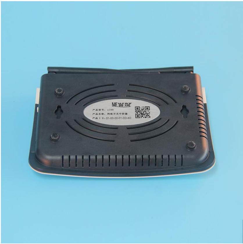
图三 e300 背面结构