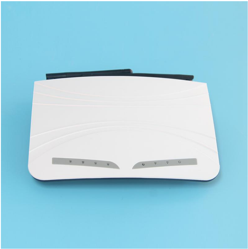
图二 e300 正面结构