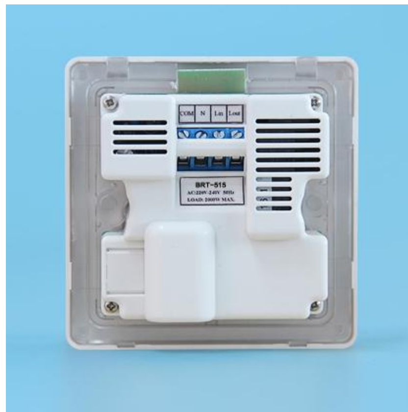
图三 BRT-515 背面结构