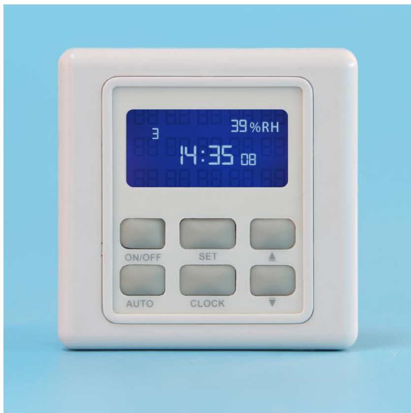
图二 BRT-515 正面结构