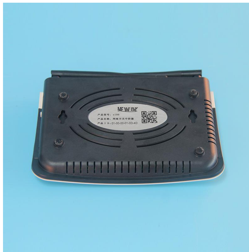
图三 e300 背面结构