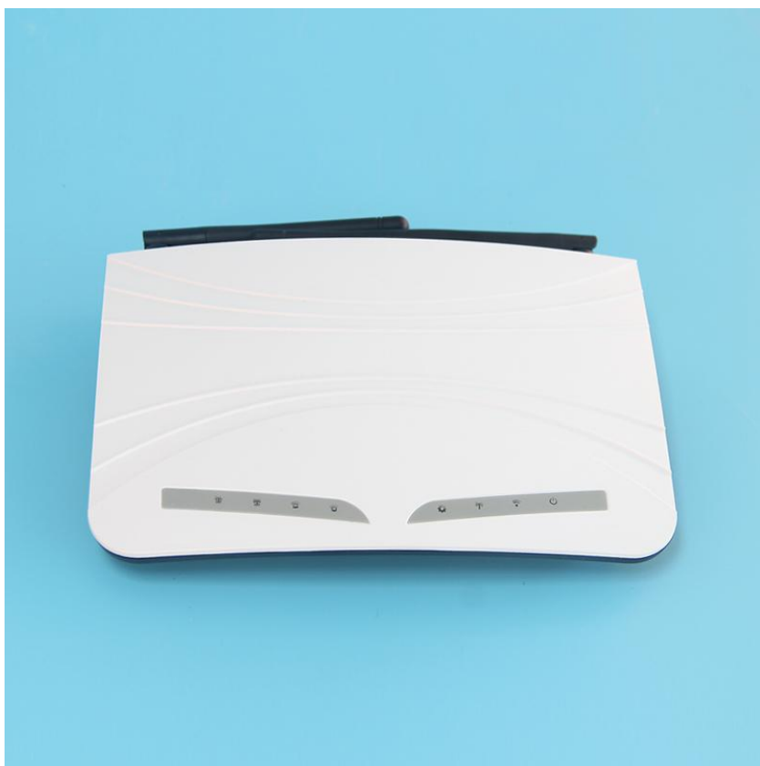
图二 e300 正面结构