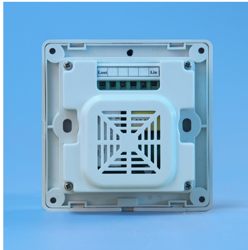
图三 产品背面结构