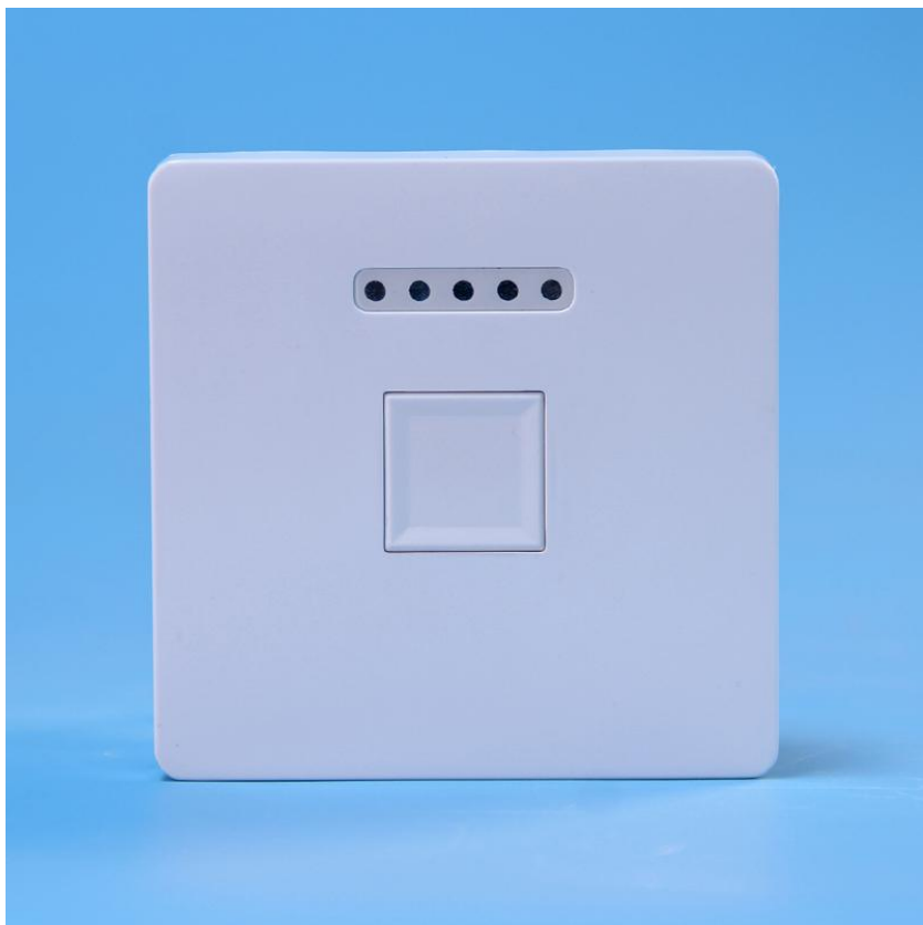
图二 产品正面结构