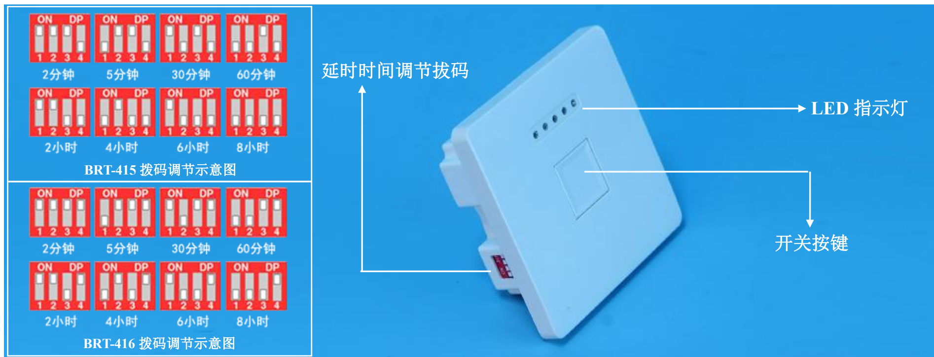
开关面板功能示意图