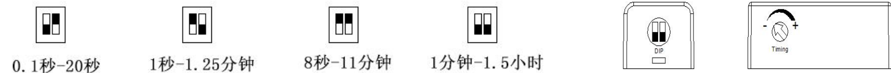
图六 延时关闭时间调节示意图