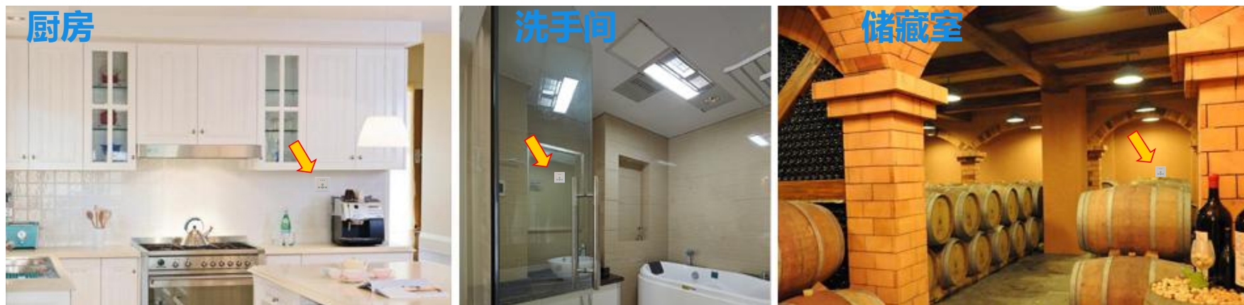
图一 产品适用场景示意图

2、排风扇延时关：排风扇工作期间，人离开后关闭照明，灯立刻熄灭，排风扇根据用户预先设定的延时时间，待环境彻底清新后，自动关闭电源。即保证排风彻底，也节能减排，避免排风扇的无效运转。