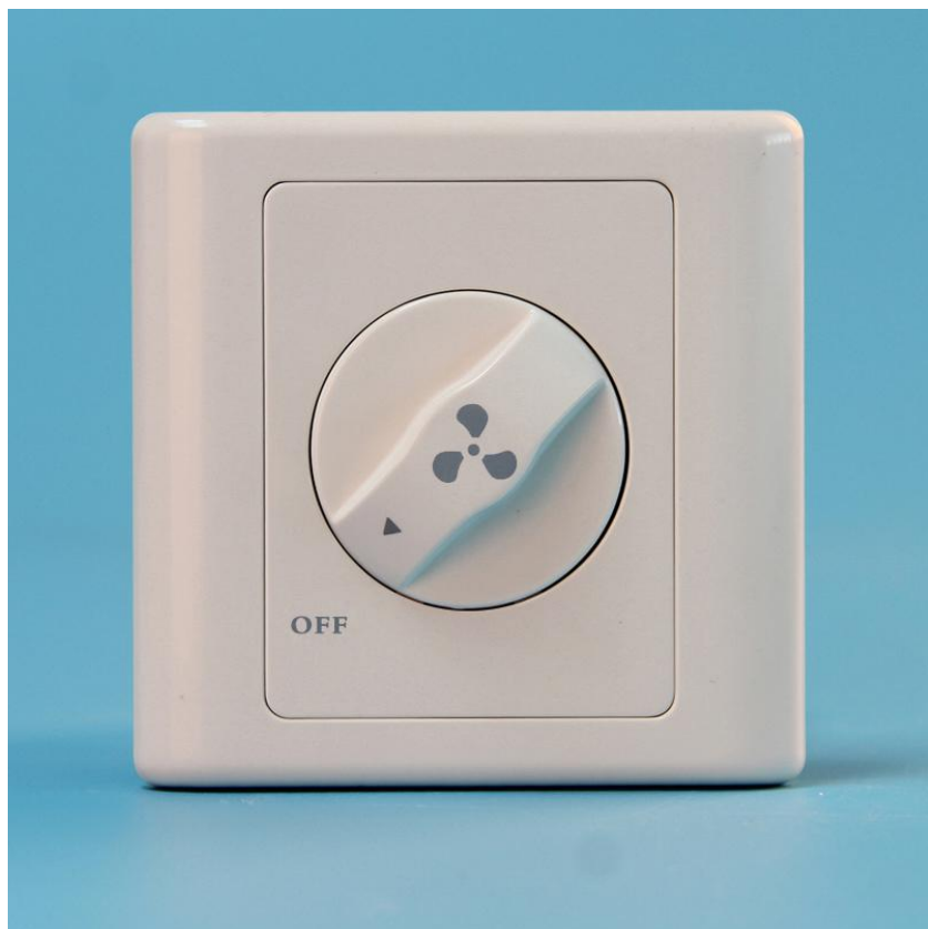
图二 产品正面结构