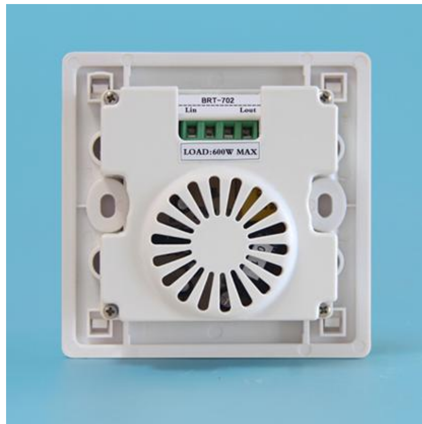
图三 产品背面结构