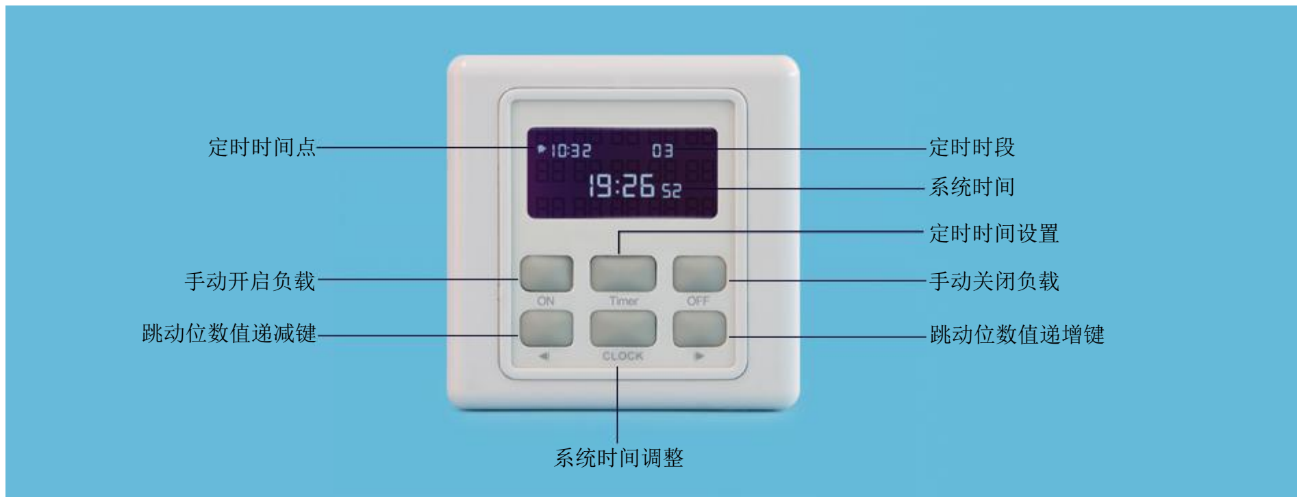
图六 开关面板各键功能示意图