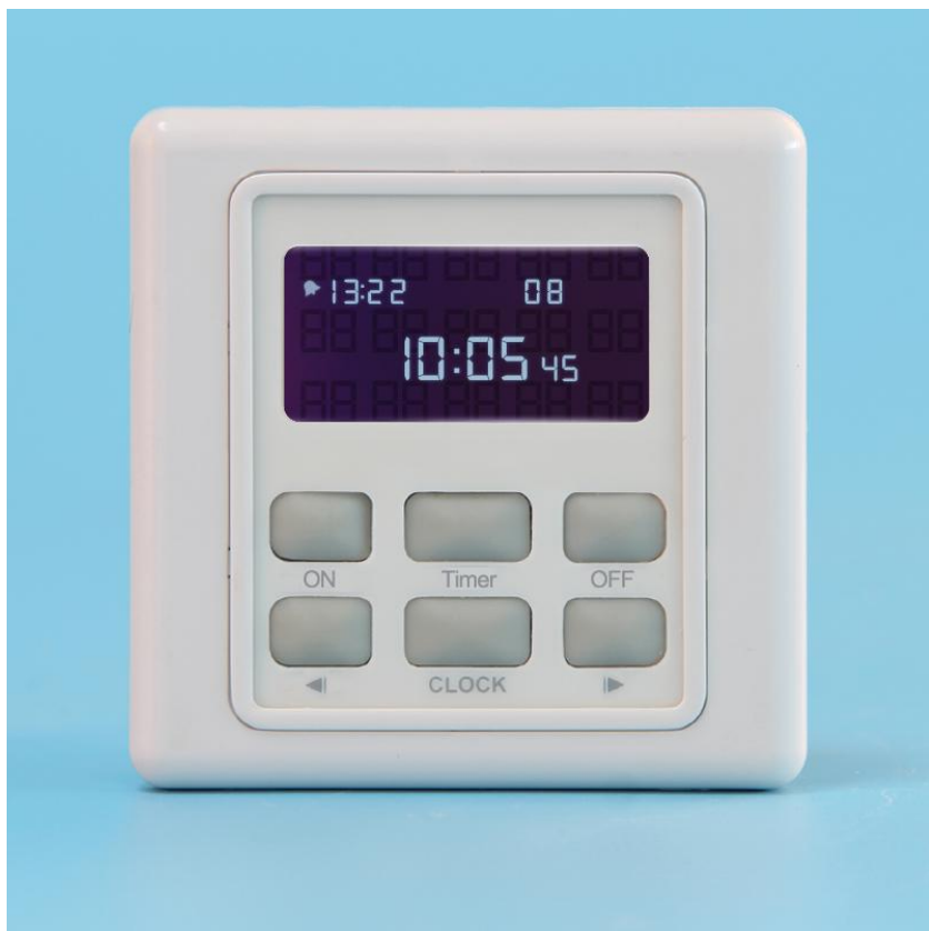
图二 产品正面结构实拍图