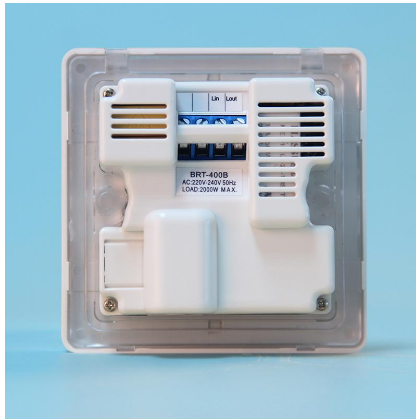
图三 产品背面结构实拍图