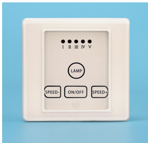
图二 BRT-F031-T BRT-F005-T 正面结构