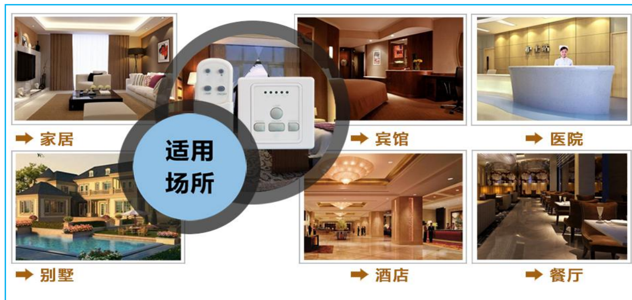
图一 产品适用场景示意图

本开关适用于各类吊扇及各种电机，如：炉具风机,管道排风机,电器设备冷却风机等速度的控制，也可用于家居、宾馆、别墅、咖啡厅、酒吧、医院及家庭住宅的室内光亮度或速度调节。