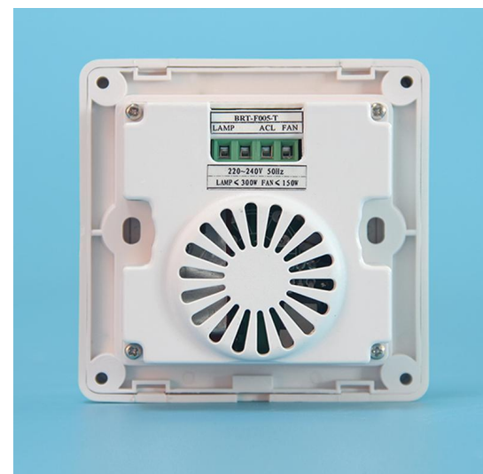
图三 BRT-F005-T 背面结构