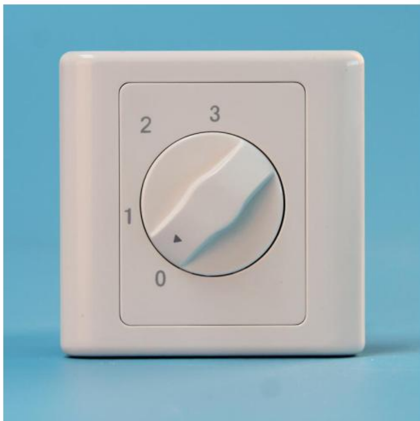
图二 BRT-F017 正面结构