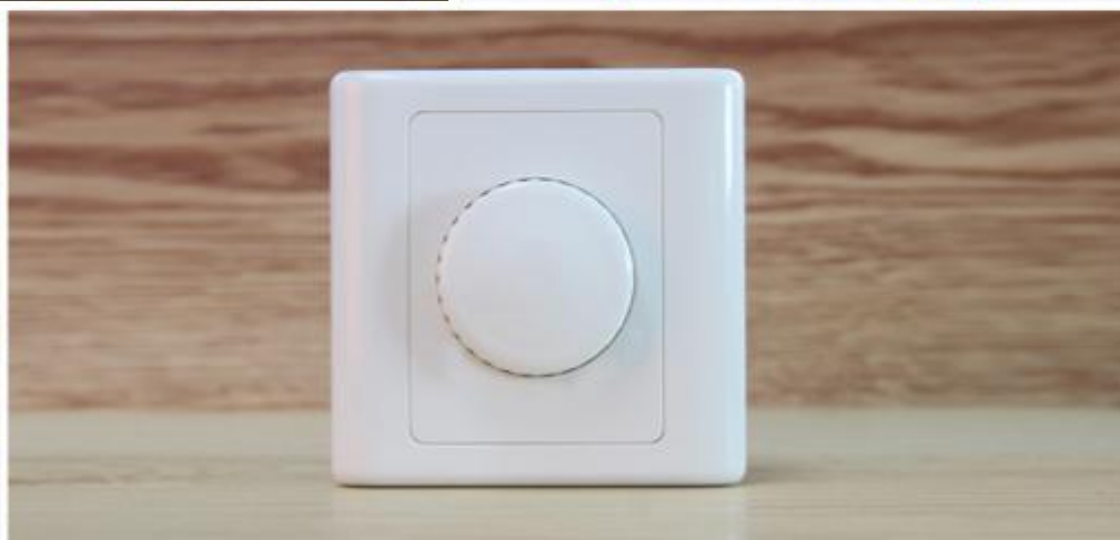
图一 产品适用场景示意图