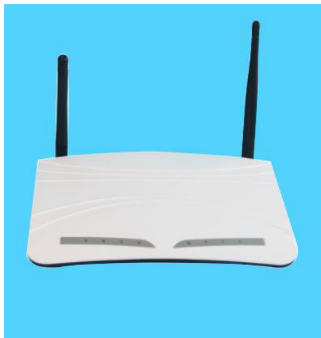
图一 e500 远程报警平台