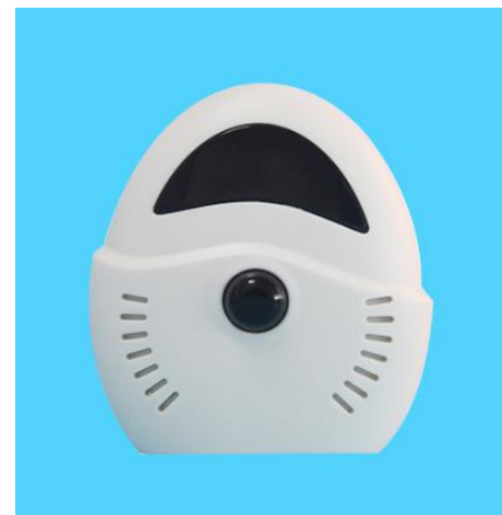
图三 s505 温湿度传感器