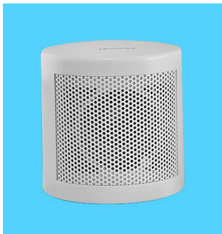
图四 GSM 智能报警器