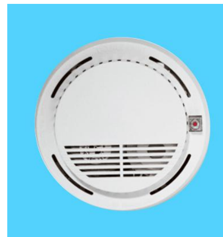
图六 s507 烟雾传感器