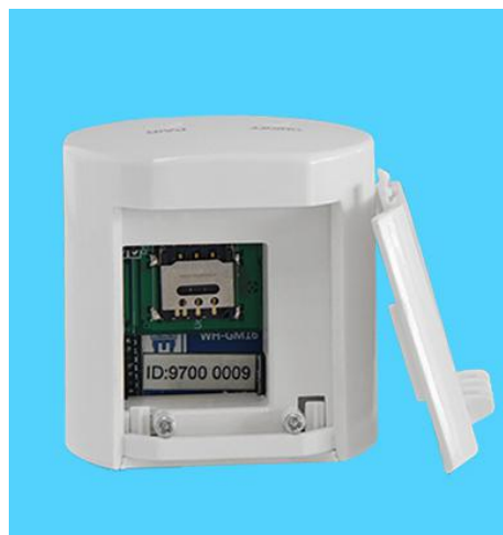
图五 GSM 智能报警器