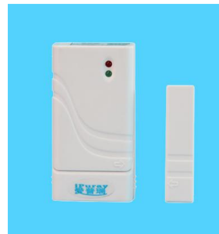
图六 s503 门磁传感器