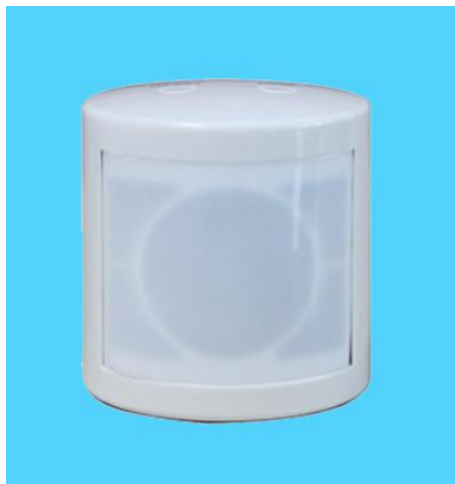
图五 s504 人体感应传感器