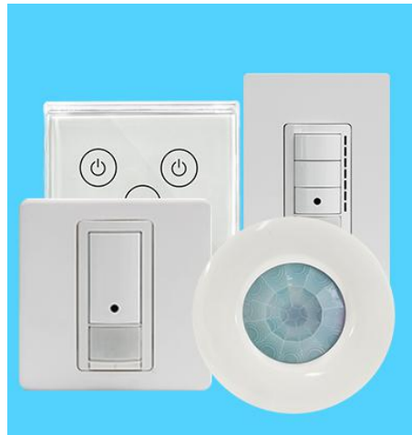
图二 物联中心开关系列产品