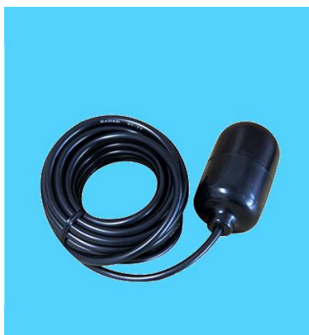
图七 s500 水位报警器