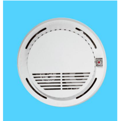
图四 s507 烟雾传感器