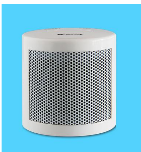
图六 us506 警铃远程转发器