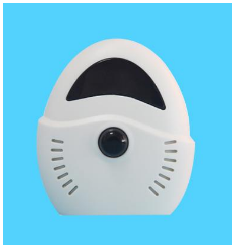
图五 s506 声音传感器