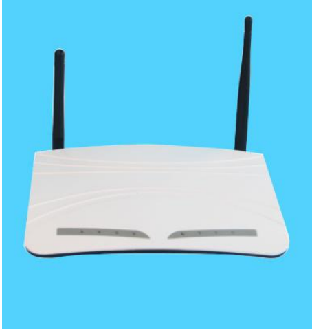
图一 e500 远程报警平台