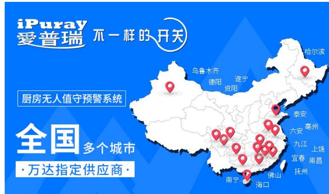
图十 实际工程案例列