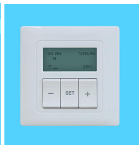
图八 s505 温湿度传感器