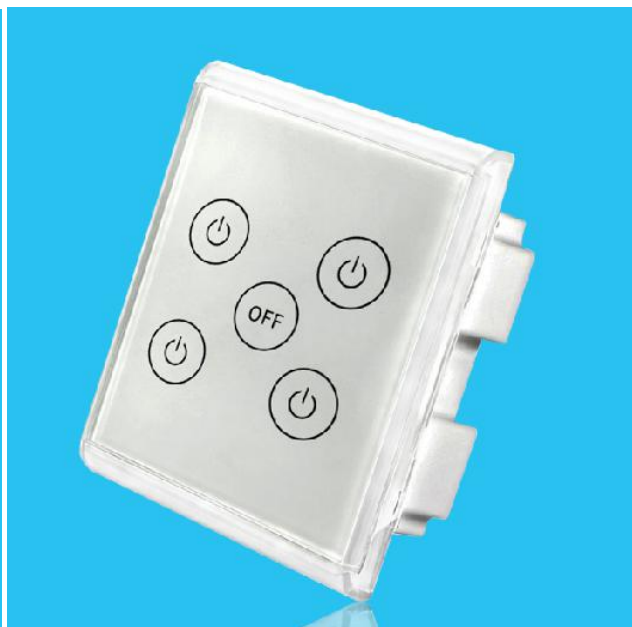
图四 产品侧面结构