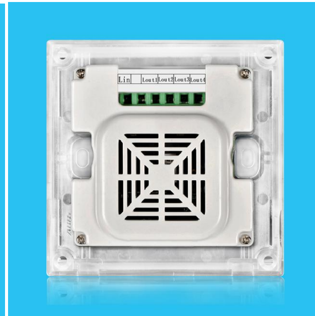
图五 产品背面结构