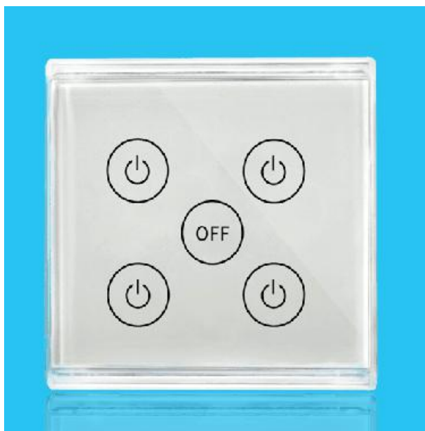
图三 产品正面结构