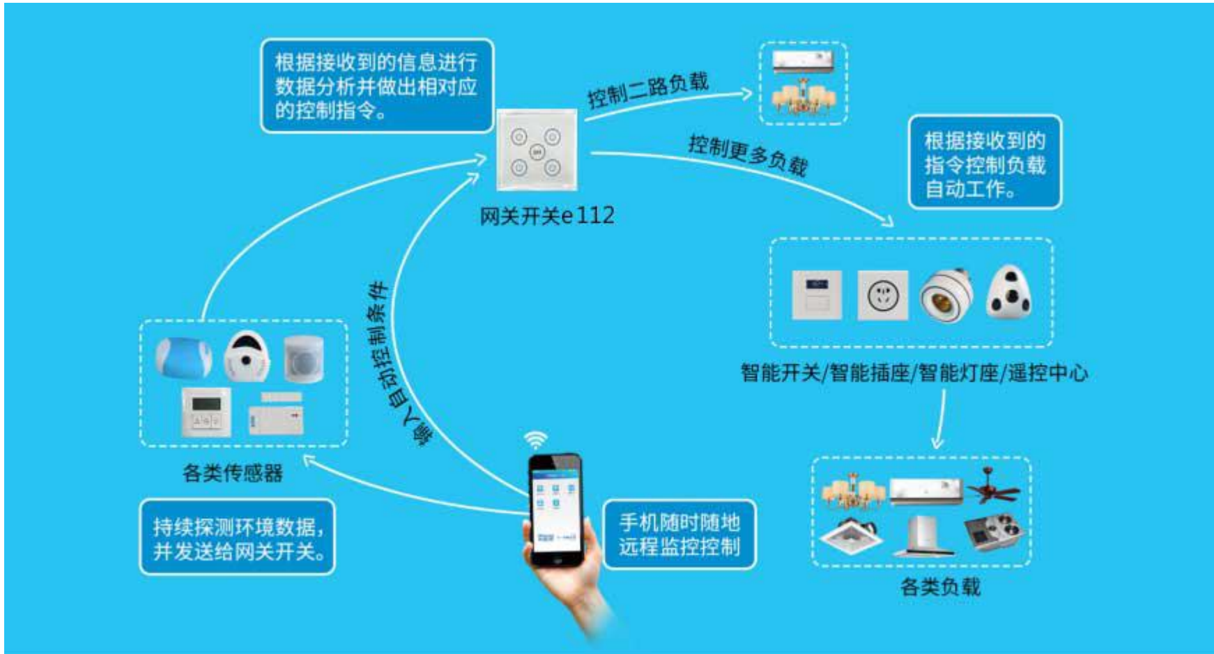
图二 智能家居系统工作流程示意图