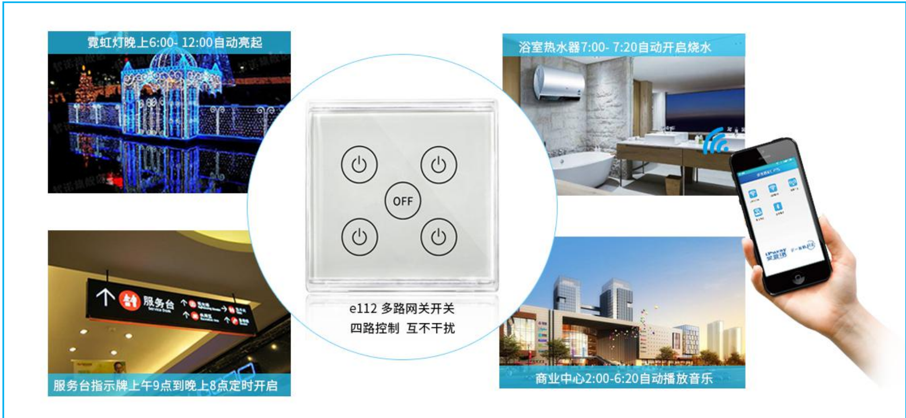
图一 单品使用场景示意图