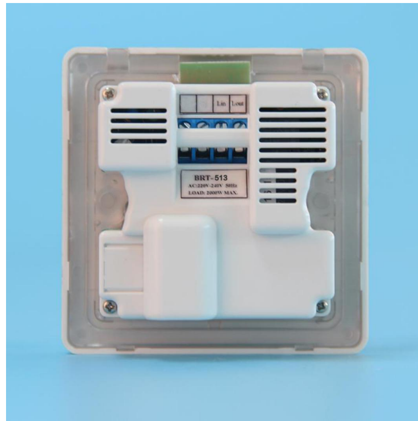
图三 产品背面结构