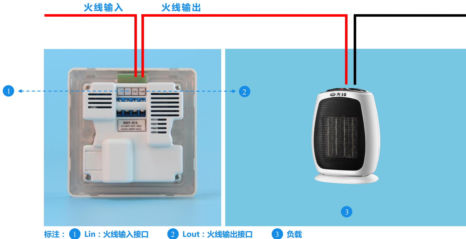
BRT-513 单火线接入接线示意图