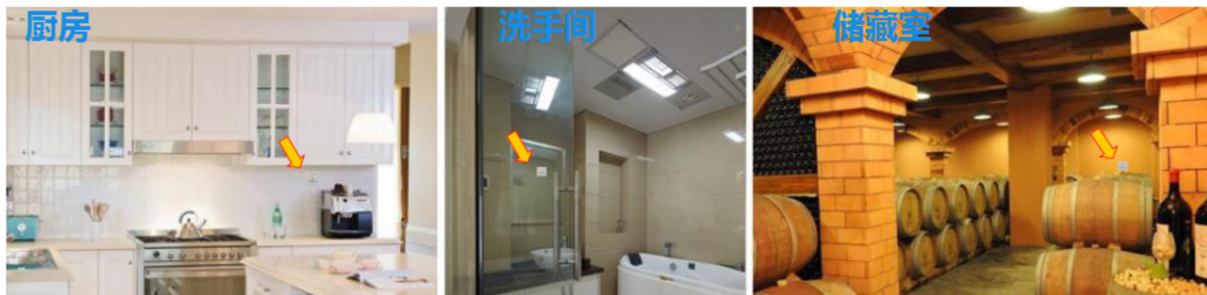
图一 产品适用场景示意图

2、排风扇延时关：排风扇工作期间，人离开后关闭照明，灯立刻熄灭，排风扇根据用户预先设定的延时时间，待环境彻底清新后，自动关闭电源。即保证排风彻底，也节能减排，避免排风扇的无效运转。