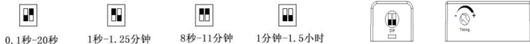
图六 延时关闭时间调节示意图