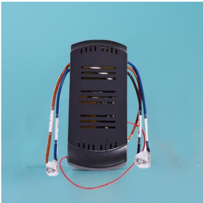
图二 AS-CF236N 吊扇遥控接收器