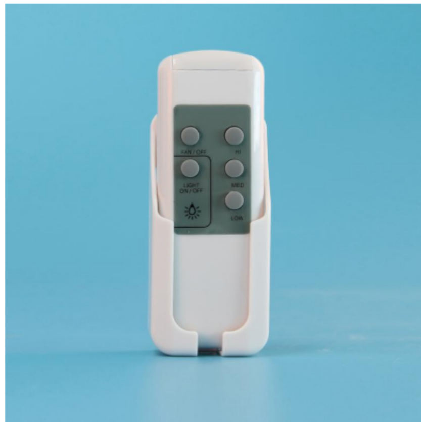
图三 AS-CF236N 吊扇遥控发射器