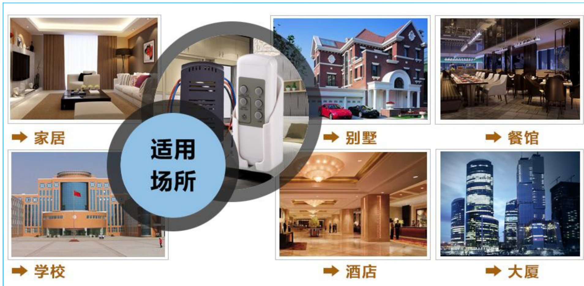
图一 产品适用场景示意图